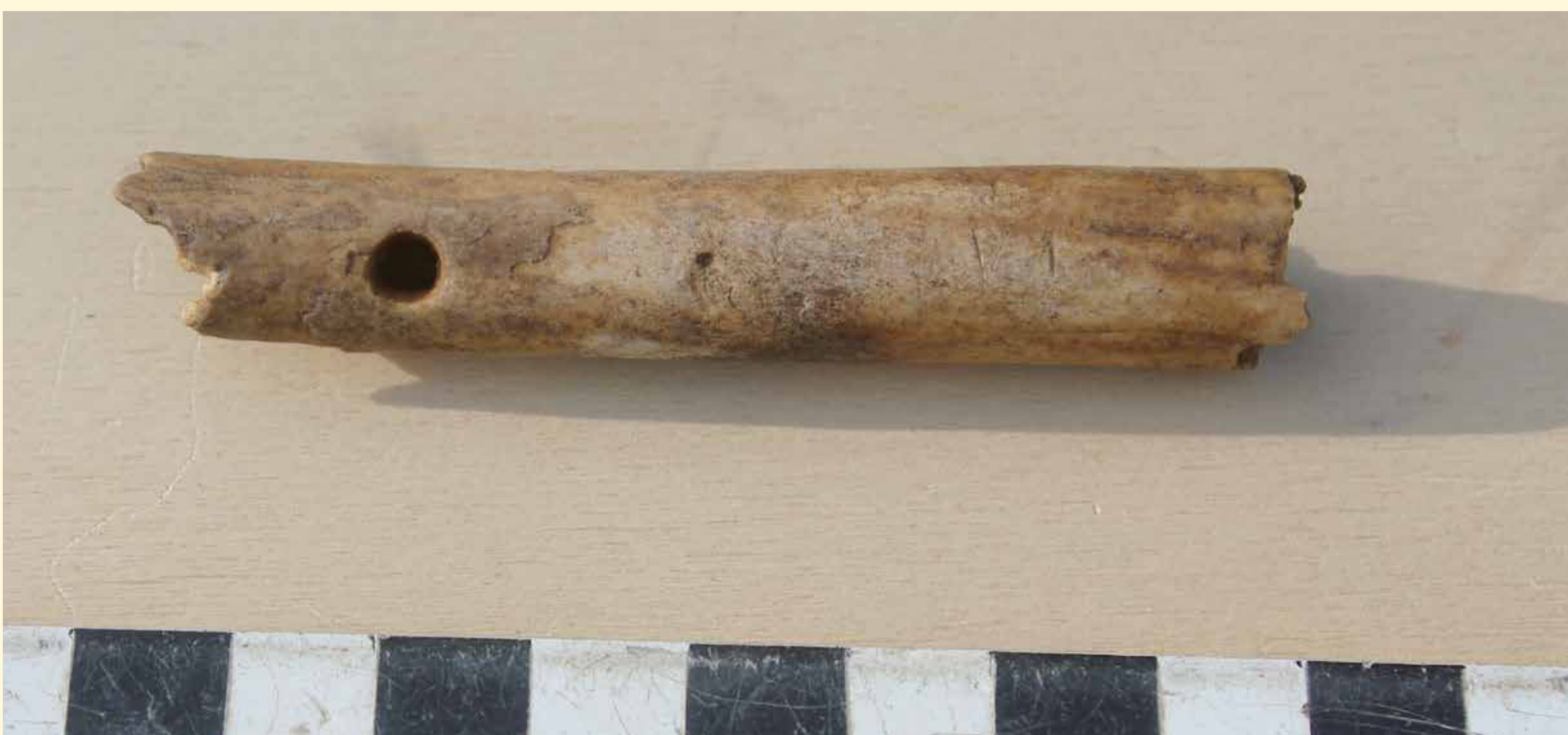
Das Fragment einer Flöte aus dem Unterschenkelknochen eines Schafs gehört zu den ältesten bekannten Musikinstrumenten Nordostbayerns. Es stammt aus der germanischen Gründungszeit Schmalnohes.

Römische Münzfunde des 4. Jahrhunderts vom nahen Maximiliansfelsen, die als Opfergabe zu deuten sind, zeigen, dass es in den ersten nachchristlichen Jahrhunderten eine intensive germanische Besiedlung des Raums gegeben haben muss. Keramikfunde und weitere Kohlenstoffdatierungen der Schmalnoher Grabung decken den Zeitraum vom 5. bis zum 13. Jahrhundert ab. Sie verdeutlichen die kontinuierliche Besiedlung Schmalnohes von der Völkerwanderungszeit bis zum Ausgang des Hochmittelalters.