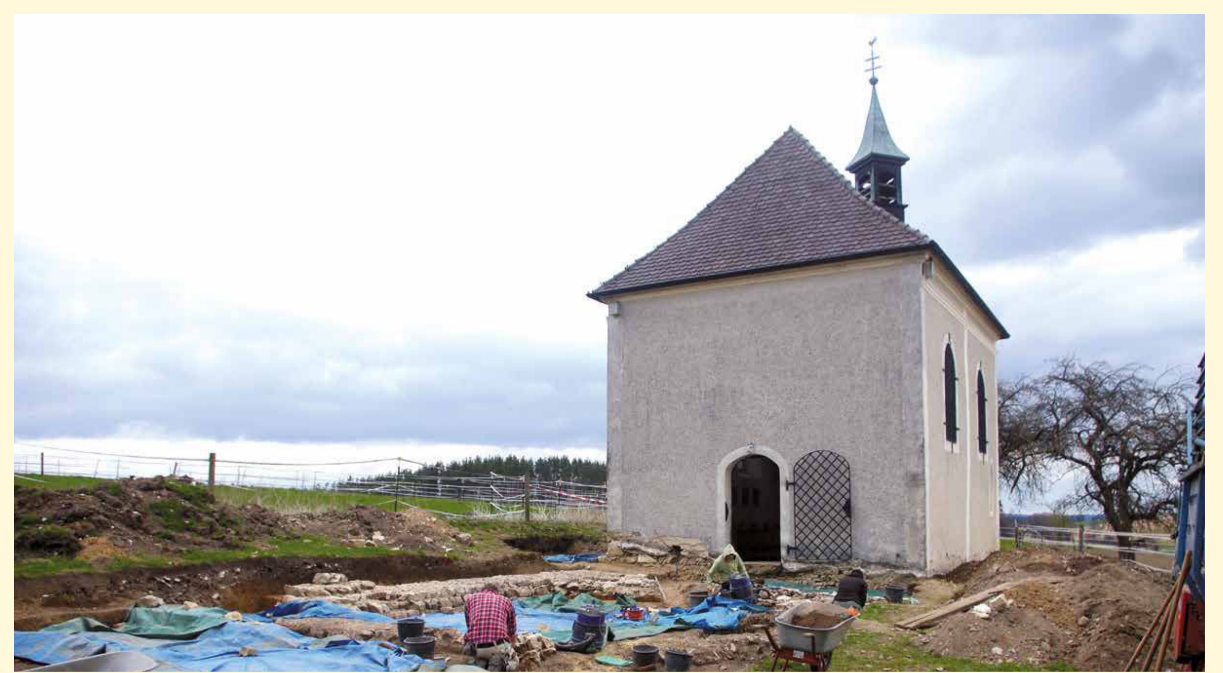
Der heutige Zustand der Kirche wird durch die Umbauten der Zeit um 1722 geprägt. Von außen nicht sichtbar, gehört die Kirche dennoch zu den ältesten in Teilen erhaltenen Kirchen nördlich der Alpen.

In die Barockzeit gehört der heutige polygonale Chor. In dieser Bauphase wurde die Kirche u.a. deutlich aufgestockt. Der Bau erhielt im Wesentlichen sein heutiges Aussehen.