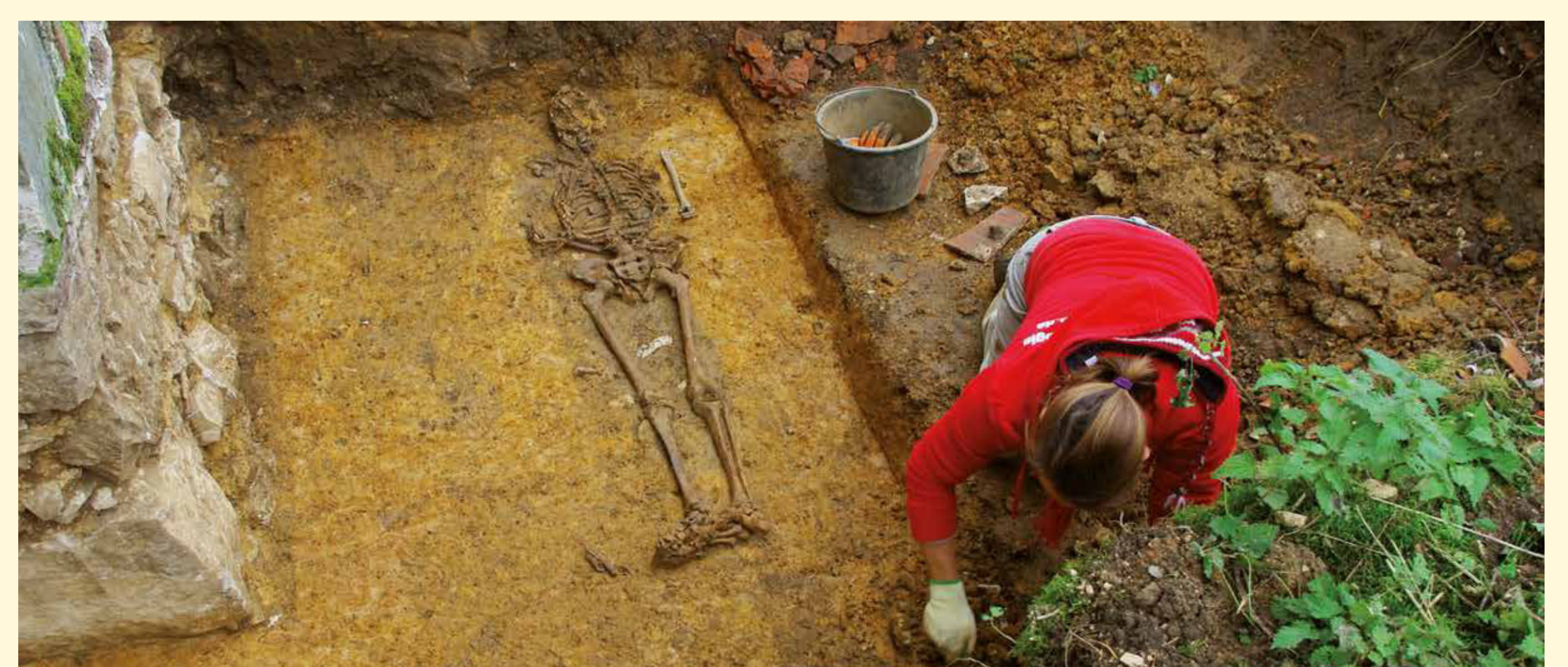
Zu den wenigen untersuchten Bestattungen gehörten auch Gräber des 13. und 14. Jahrhunderts. Sie belegen eine Fortführung der sakralen Nutzung des Platzes auch nach dem Ende Schmalnohes als Herrschaftssitz. Einige Gräber enthielten kleine Silbermünzen als Grabbeigabe (sogenannte Charonspfennige).

Das Areal war nun dicht mit hölzernen Wirtschaftsgebäuden bebaut. Das Gelände des ehemaligen Herrenhofs wurde im 13. Jahrhundert handwerklich genutzt. Neben einem Backofen fanden sich ein Schmelzofen zur Verhüttung von Eisenerzen sowie eine Schmiedessegrube aus dieser Zeit. Die sakrale Nutzung des Platzes setzte sich jedoch fort. Hiervon zeugt u.a. der Friedhof neben der Kirche.